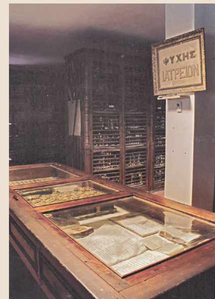
Άποψη του εσωτερικού της βιβλιοθήκης χειρογράφων και εντύπων σε ανεξάρτητο κτίριο στην αυλή της Μονής Ιβήρων, που λειτουργήσε έως τις αρχές του 2010. Μετέπειτα μεταφέρθηκε στην ανατολική πτέρυγα της Μονής.

Κάθε βιβλιοθήκη παρουσιάζεται με εκτεταμένο δίγλωσσο λήμμα, στο οποίο περιλαμβάνονται πληροφορίες τόσο για το περιεχόμενο της συλλογής και το ιστορικό της συγκρότησής της όσο και για την ιστορία της μονής και συνοδεύεται από πλούσιο εικαστικό υλικό, συχνά σπάνιο, και επιλεγμένη βιβλιογραφία.