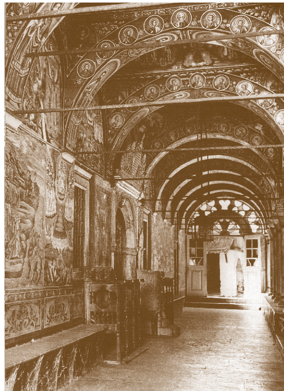
Άποψη του εξωνάρθηκα του Καθολικού της Μονής Μεγίστης Λαύρας. Ασπρόμαυρη φωτογραφία του Σπύρου Μελέτζη, 1950.

Ωστόσο, αυτή την περίοδο αρχίζουν και οι απώλειες χειρογράφων. Η πρώτη γνωστή περίπτωση είναι αυτή του λόγιου Νικόλαου Σοφιανού (16ος αι.), για τον οποίο όμως δεν είναι γνωστό πόσα και ποια χειρόγραφα αφαίρεσε. Αντιθέτως, υπάρχουν πολλά στοιχεία για τον