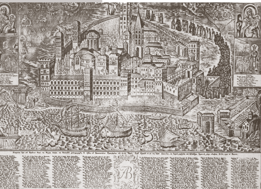
Η Μονή Βατοπαιδίου. Χαλκογραφία άγνωστου χαρακτή που τυπώθηκε στη Βενετία από τον Αντόνιο Βόρτολι, 1802.

Κατά τον 19ο αιώνα έχουμε επίσης πολλές μεταποπίσεις κωδίκων και αφορούν κυρίως κώδικες κλασικού περιεχομένου, όπως του Άγγλου περιηγητή Κλαρκ, του Έλληνα Μηνά Μινωΐδη, του Κωνσταντίνου Σιμωνΐδη και του Ρώσου αρχιμανδρίτη Πορφυρίου Ουσπένσκι.