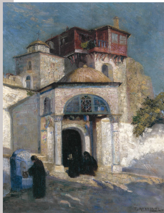
Η είσοδος της Μονής Βατοπαιδίου. Ελαιογραφία του Τάσου Λουκΐδη, 1915 (Καλλιτεχνική Συλλογή Εθνικής Τραπέζης της Ελλάδος).