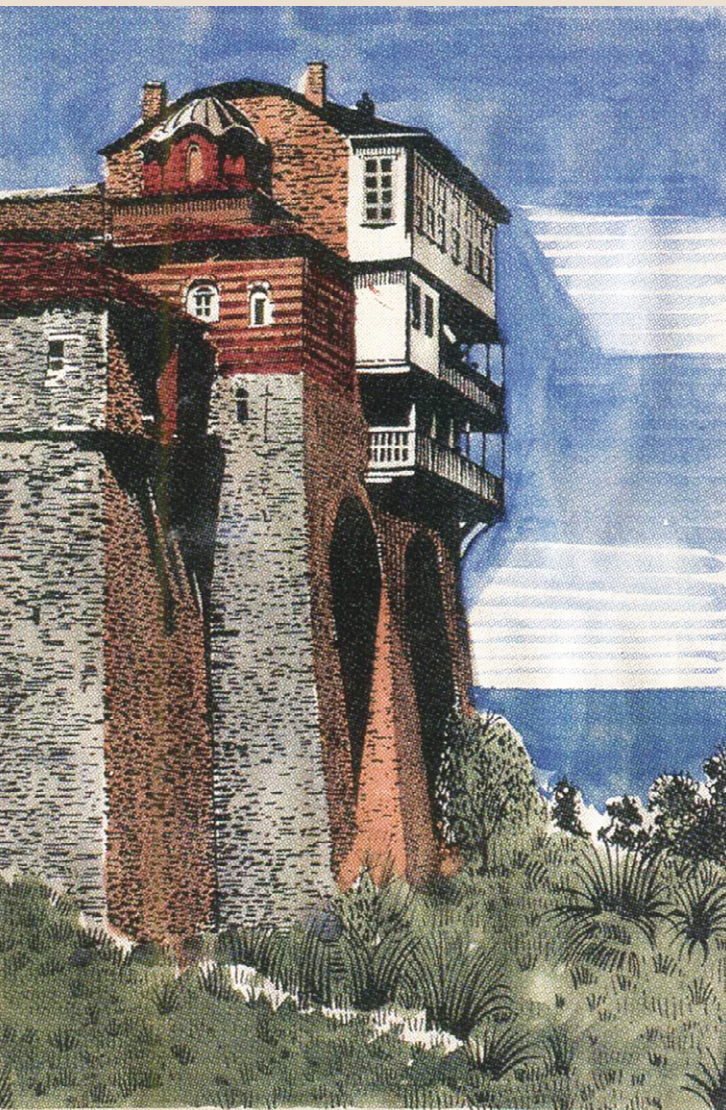
Άποψη της Μονής Σταυρονικήτα. Μακέτα για το δίδραχμο γραμματόσημο της έκδοσης «Άγιον Όρος», φιλοτεχνημένη από τον Τάσσο, 1963.