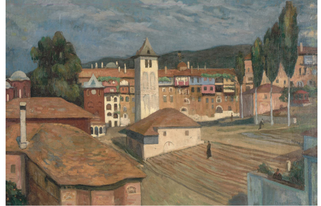
Η Μονή Βατοπαιδίου. Ελαιογραφία του Λυκούργου Κογεβίνα (Συλλογή Ε. και Γ. Δαλακούρα).

Μέχρι σήμερα η Βιβλιοθήκη της Μονής Μεγίστης Λαύρας στεγάζεται στο αυτόνομο κτίριο του 1870 που επεκτάθηκε κατά δύο κεραίες το 1958. Από το 1983 έως το 2018 πραγματοποιήθηκε από το Κέντρο Διατήρησης Αγιορειτικής Κληρονομιάς μια σειρά επεμβάσεων και ανακαινίσεων, διαμόρφωσης και λειτουργικότητας των χώρων όπου στεγάζεται το παλαιό σκευοφυλάκιο και η βιβλιοθήκη των χειρογράφων, αλλά και των εντύπων, τόσο των παλαιτύπων όσο και των νεότερων. Στο ανατολικό τμήμα της βόρειας πτέρυγας του 1984 λειτούργησε η νέα βιβλιοθήκη των σύγχρονων εντύπων.