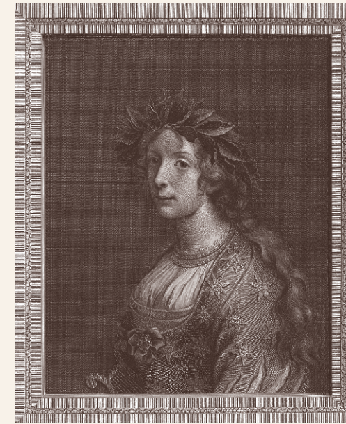
Πορτρέτο της Σαπφώς. Χαρακτικό των Ρόμπερτ Στρέιντζ και Κάρλο Ντόλτσι, 1787.

Ο έρωτας, προς τις γυναίκες κυρίως, είναι το βασικό θέμα της, ακόμη και σε προσευχές και ύμνους όπως το μοναδικό ποίημα που μας σώθηκε ολόκληρο, η Προσευχή στην Αφροδίτη . Σύμφωνα με τον Φ.Ι. Κακριδή, οι