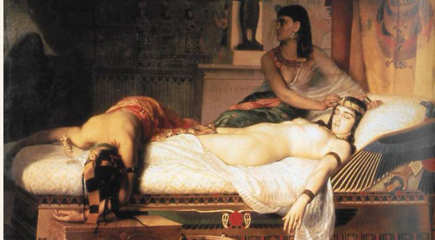
Ο θάνατος της Κλεοπάτρας. Πίνακας του Ζαν Αντρέ Ριζέν, 1874.

Η ιδιαίτερα ευφυής αυτή γυναίκα είχε σαγηνεύσει τον Ιούλιο Καίσαρα και τον Μάρκο Αντώνιο και βρέθηκε στο επίκεντρο της πολιτικής ζωής της Ρώμης, ιδίως μετά τη δολοφονία του πρώτου. Σύμφωνα με τον Πλούταρχο, η Κλεοπάτρα ήταν η μόνη από τη δυναστεία των Πτολεμαίων που γνώριζε να χειρίζεται την αιγυπτιακή γλώσσα και γραφή —λέγεται ότι μιλούσε δέκα γλώσσες—, άλλωστε ο ίδιος ο Έλληνας φιλόσοφος και βιογράφος από τη Χαιρώνεια αναφέρεται με κολακευτικά λόγια στο πνεύμα της και στα ποικίλα γνωστικά της ενδιαφέροντα. Γύρω από τον Μάρκο Αντώνιο και την Κλεοπάτρα είχε διαμορφωθεί ένας κύκλος νέων επιστημόνων που θεράπευαν την τέχνη του Ιπποκράτη. Μεταξύ αυτών ο Διοσκουρίδης ο Φακάς —προσωπικός γιατρός