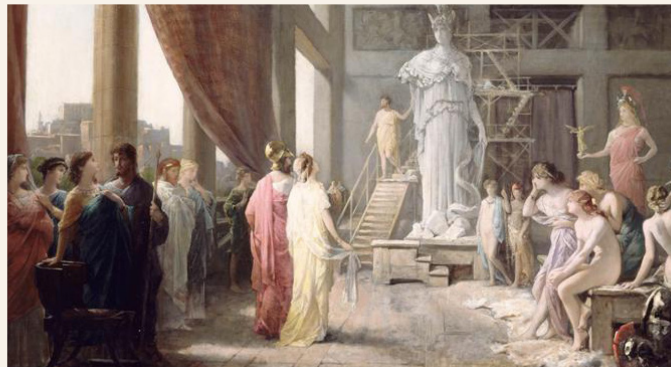
Ο Περικλής και η Ασπασία στα αποκαλυπτήρια του χρυσελεφάντινου αγάλματος της θεάς Αθηνάς στο εργαστήριο του Φειδία. Ελαιογραφία του Λουί Εκτόρ Λερού, 1789-1914.

Το φθινόπωρο του 429 π.Χ., χρονιά κατά την οποία η Αθήνα δοκιμαζόταν από τον λοιμό, πεθαίνει ο Περικλής αλλά και πλήθος φίλων της Ασπασίας, που βιώνει θλιβερές στιγμές, μέσα σε ένα έκρυθμο πολιτικό σκηνικό. Ήταν η στιγμή που οι Αθηναίοι