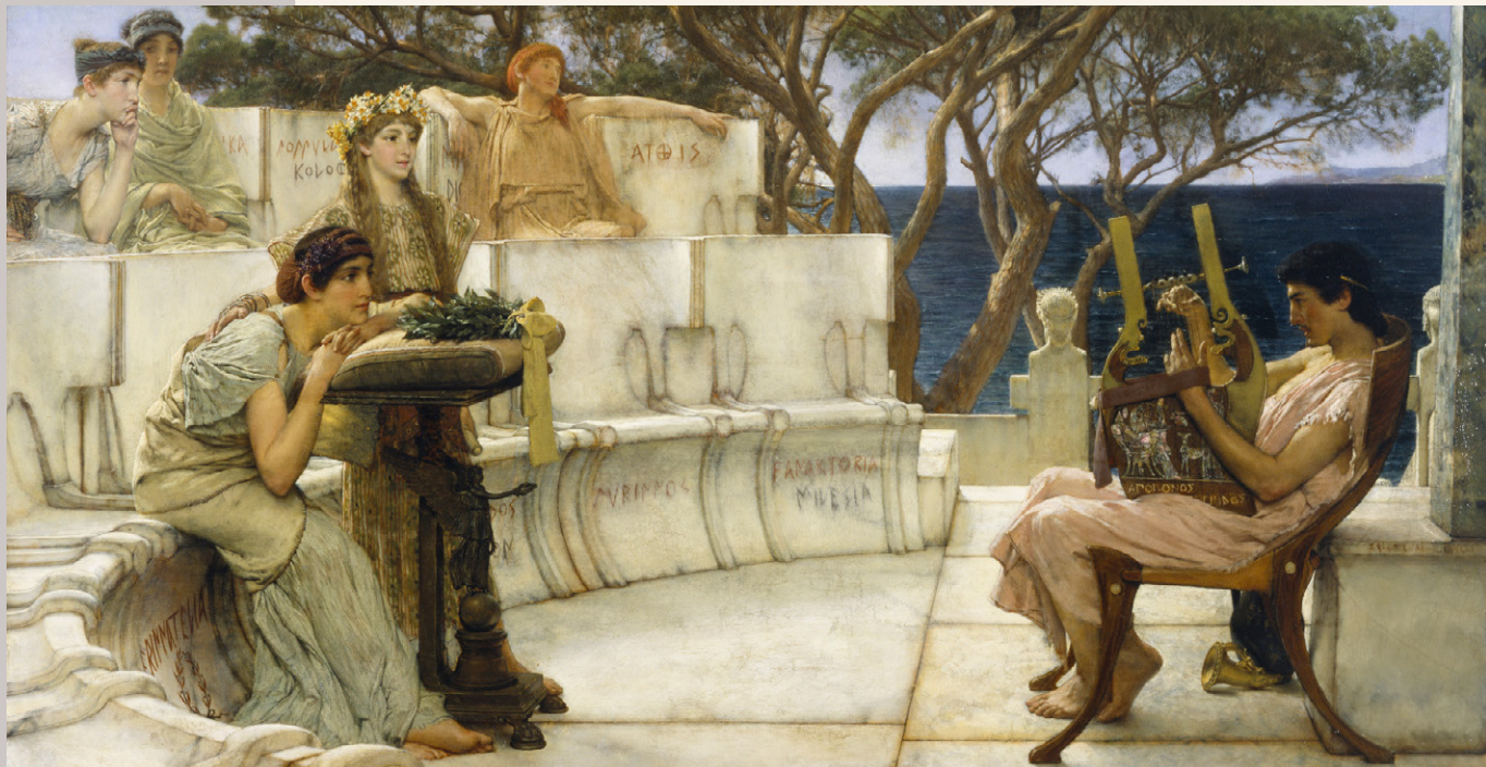
Σαπφώ και Αλκαίος. Ελαιογραφία του Λώρενς Άλμα Τάντεμα, 1881.

Ο Ι ΠΛΗΡΟΦΟΡΙΕΣ που έχουμε για τη ζωή και τη δράση της Σαπφώς, της δέκατης Μούσας, όπως ονομάστηκε ( Παλατινή Ανθολογία VII 44), είναι συνυφασμένες με την ιστορία και τον θρύλο. Το λεξικό της Σούδας τοποθετεί τη γέννησή της στην 42η Ολυμπιάδα: Λεσβία ἐξ Ἐρεσσοῦ, λυρική, γεγονυῖα κατὰ τὴν μβ Ὀλυμπιάδα, ὅτε καὶ Ἀλκαῖος ἦν καὶ Στησίχορος καὶ Πιττακός («Ἦταν λυρική ποιήτρια από τη Λέσβο γεννημένη στην Ερεσσό κατά την 42η Ολυμπιάδα [δηλαδή περίπου από το 612 π.Χ. έως το 609 π.Χ.], την εποχή που ζούσαν ο Αλκαίος και ο Στησίχορος και ο Πιττακός»). Μπορούμε, ωστόσο, να είμαστε βέβαιοι ότι η περίφημη ποιήτρια ανήκε σε αριστοκρατική οικογένεια, ότι σχετίστηκε με τον Πιττακό και τον Αλκαίο, και ότι για ένα μικρό διάστημα, γύρω στα 600 π.Χ., όπως μαρτυρεί το Πάριο Χρονικό , έζησε εξόριστη για πολιτικούς λόγους στη Σικελία, πιθανόν γιατί η οικογένειά της είχε εμπλακεί στην πολιτική ζωή του τόπου. Άλλωστε οι πολιτικές ταραχές και οι πολιτειακές ανατροπές στα χρόνια της ήταν συνεχείς.