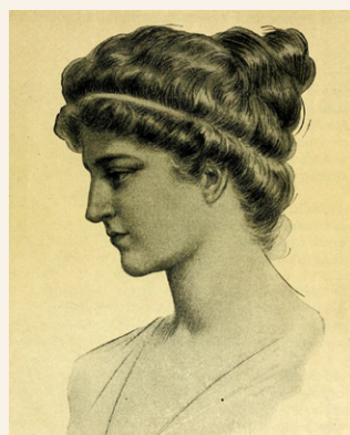
Πορτρέτο της Υπατίας. Σχέδιο του Ζυλ Μωρίς Γκασπάρ από την έκδοση: Elbert Hubbard, Little journeys to the homes of great teachers , Νέα Υόρκη, Wm. H. Wise & Co, 1916.

αποκαλούμενη Καισαρείον, της έσχισαν τα ρούχα και την έσυραν στους δρόμους μέχρι θανάτου. Τη μετέφεραν σε μία τοποθεσία ονομαζόμενη Κίναρον και έκαψαν το σώμα της, ενώ το πλήθος περιτριγύριζε τον πατριάρχη Κύριλλο αποκαλώντας τον «νέο Θεόφιλο», γιατί είχε καταστρέψει τα απομεινάρια της ειδωλολατρίας στην πόλη.