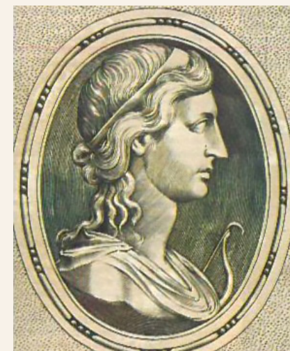
Πορτρέτο της Κλεοπάτρας. Χαρακτικό από την έκδοση: Johann Faber, In Imagines illustrium ex Fulvii Ursini bibliotheca ... , Αμβέρσα, ex officina Plantiniana, apud Ioannem Moretum, 1606.

Αναφορικά με τη Βιβλιοθήκη της Αλεξάνδρειας, το όνομά της συνδέεται με δύο γεγονότα: την υποτιθέμενη πυρπόληση τμήματος της Βιβλιοθήκης κατά την πολιορκία από τον στρατηγό του Καίσαρα Αχιλλά (47 π.Χ.) και την απόκτηση 200.000 τόμων από τη Βιβλιοθήκη της Περγάμου, τους οποίους φέρεται να της δώρισε ο Μάρκος Αντώνιος.