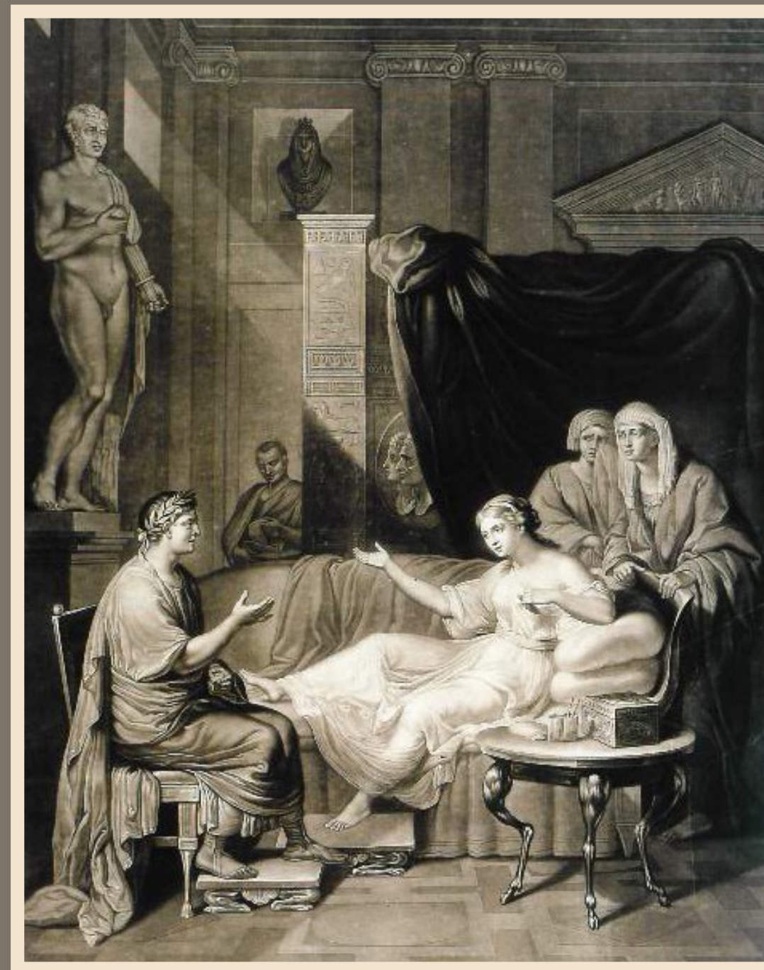
Συνομιλία του Αυγούστου και της Κλεοπάτρας. Χαρακτικό του Ρίτσαρντ Έρλομ, 1784.